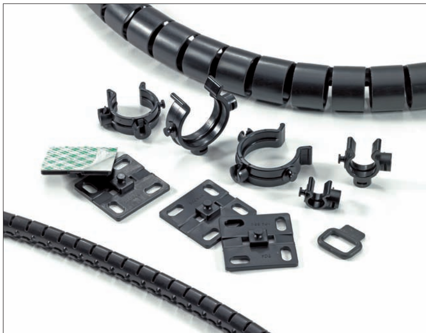
Sets de Accesorios Helawrap, sus cables quedarán ordenados, protegidos y fijos, fácil y rápidamente.

Los Clips y Bases Helawrap pueden unirse, para envolver, proteger y fijar cualquier número de cables a/en máquinas industriales. También es posible usarlos en armarios eléctricos, particularmente en la zona de la puerta, donde el movimiento es necesario. Los accesorios de Helawrap también se usan, para los cables de casa o de la oficina.