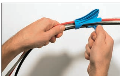
Introduzca uno o más cables en la abertura de la herramienta.