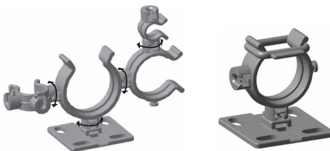
Todos los Clips son Conectables, y Giran libremente.