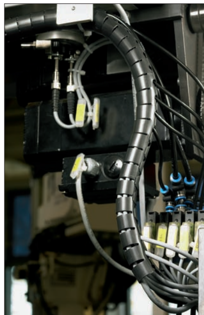
Es posible bifurcar cables en cualquier punto a lo largo de su cuerpo, con mejor protección y flexibilidad.

Uno de los mercados más habituales de la Helawrap HWPV-A0 es el ferroviario, dados sus estrictos requerimientos de NF F16-101 y 16-102 que HWPV-A0 cumple.