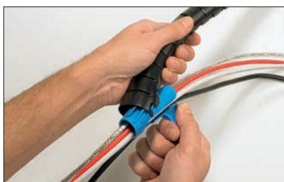
Coloque la herramienta en un extremo de la Helawrap.