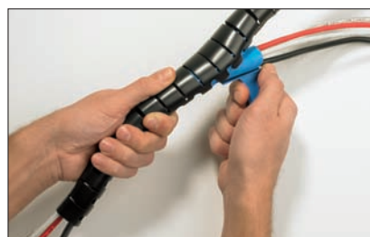
Como si fuese una "cremallera" Helawrap cubre sus cables, simplemente resbalando la herramienta a través del tubo.