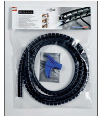
¡Helawrap, la solución rápida y fácil, para esos desordenados y líosos cables, disponible en 2 tamaños y 3 colores!